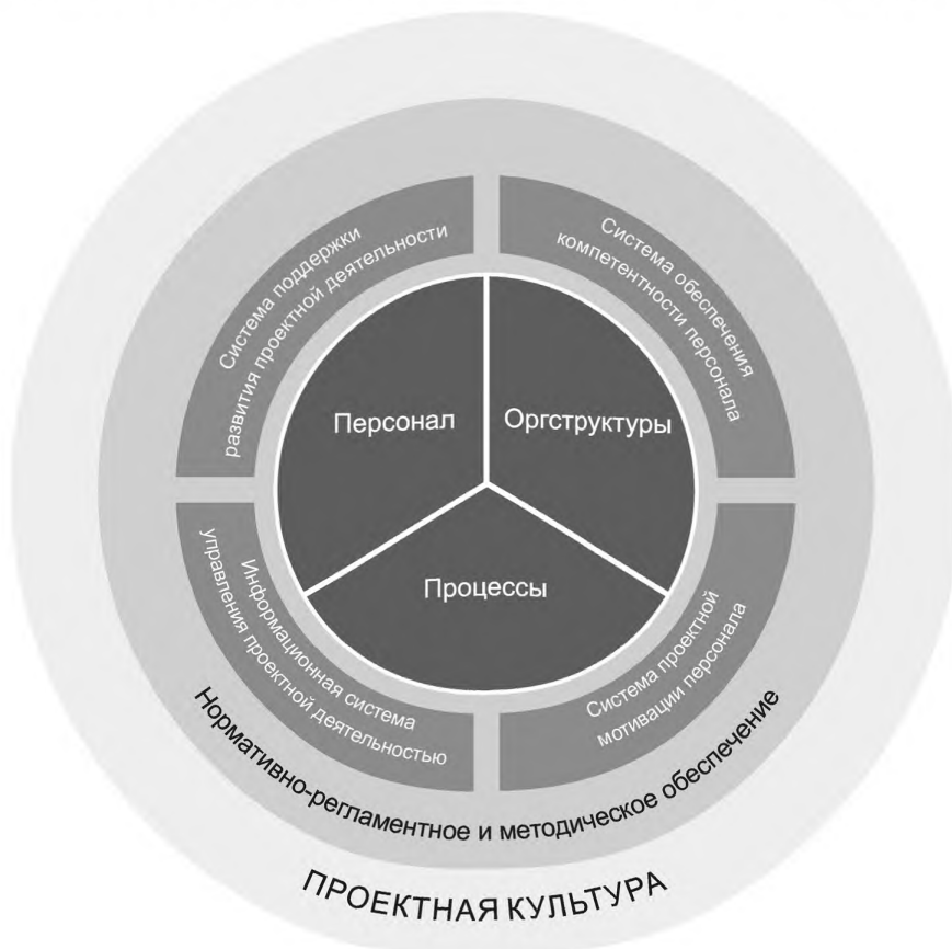
Рисунок 2 — Элементы системы менеджмента проектной деятельности в организации

Все элементы СМГД должны быть задокументированы и поддерживаться нормативно-регламентным и методическим обеспечением (требования к документированию описаны в 6.10).